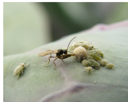
Blattlausschlupfwespen legen ihre Eier in Blattläuse ab