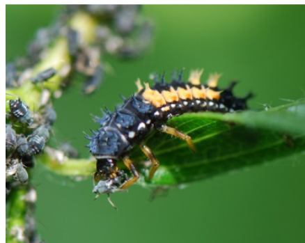
Marienkäferlarve frisst Blattlaus