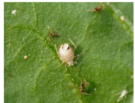
Von einer Schlupfwespe parasitierte und abgetötete Blattlaus

Wichtig ist es vor allem aber auch, dass Nützlinge als solche erkannt und nicht als vermeintliche Pflanzenschädlinge bekämpft werden. Untersuchen Sie ihre Pflanzen vor einer Bekämpfungsmaßnahme daher immer erst genau und überprüfen Sie, ob ihre Pflanzen tatsächlich nur von Schädlingen und nicht evtl. bereits auch von Nützlingen besiedelt sind – denn dann ist eine Bekämpfung oft gar nicht mehr erforderlich.