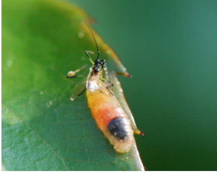
Larve einer Schwebfliege saugt Blattlaus aus

z. B. Schwebfliegen durch das Anpflanzen von attraktiven Blütenpflanzen wie Korb- und Doldenblütlern anlocken und fördern. Vielleicht findet sich in Ihrem Garten auch irgendwo eine Ecke, in der Sie Wildpflanzen ungestört wachsen lassen können. Diese werden dann sicher ebenfalls gerne von Nützlingen aufgesucht und besiedelt.