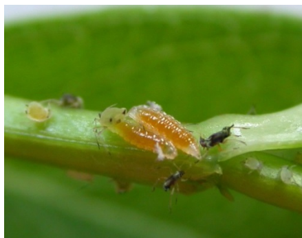
Larven der Räuberischen Gallmücke

Speziell für Florfliegen gibt es darüber hinaus rotbraune, mit Stroh gefüllte Florfliegenhäuschen, die man im Garten aufstellen kann, um sie ihnen als Unterschlupf für die Überwinterung anzubieten. Ohrwürmer lassen sich auch mit umgedrehten und mit Stroh, Heu oder Holzwolle gefüllten Tontöpfen ansiedeln, die man hierzu z. B. in die Obstbäume hängt.