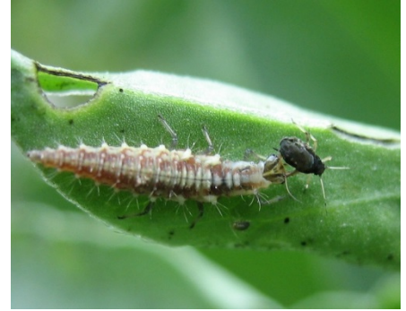
Florfliegenlarve mit einer Blattlaus als Beute

Speziell für Florfliegen gibt es darüber hinaus rotbraune, mit Stroh gefüllte Florfliegenhäuschen, die man im Garten aufstellen kann, um sie ihnen als Unterschlupf für die Überwinterung anzubieten. Ohrwürmer lassen sich auch mit umgedrehten und mit Stroh, Heu oder Holzwolle gefüllten Tontöpfen ansiedeln, die man hierzu z. B. in die Obstbäume hängt.